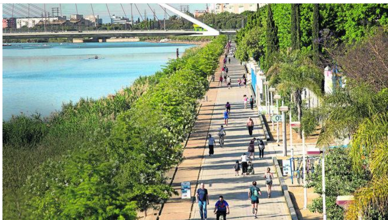
Viandantes pasean junto al río Guadalquivir.

TEXTO: ANA S. AMENEIRO 20 MAYO, 2018 - 07:32H