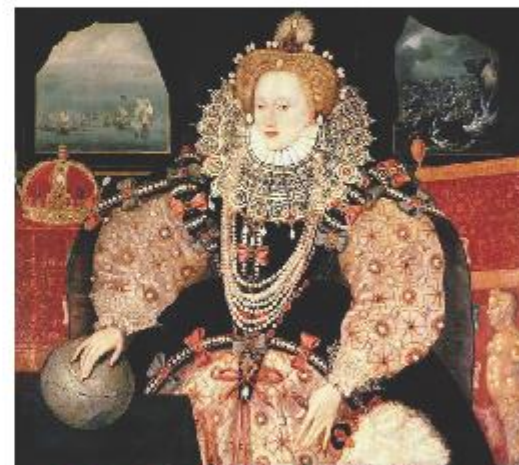
LA MÚSICA INGLESA EN LA CORTE DE ISABEL I